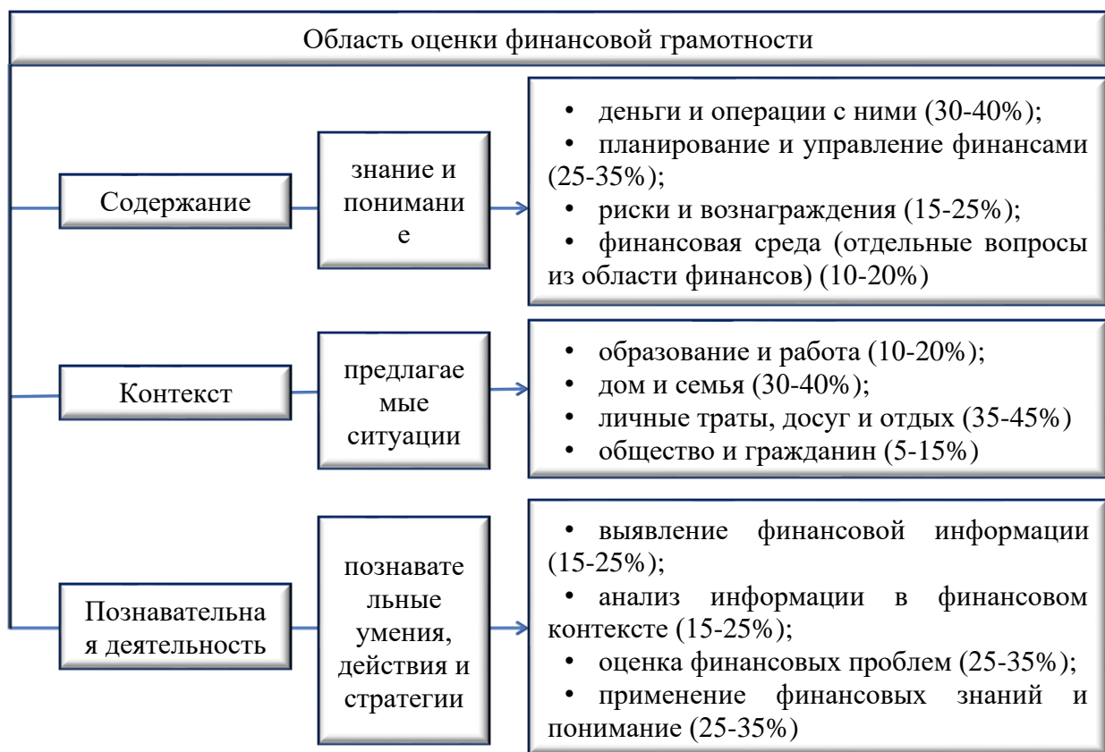
Рисунок 1 – Компоненты финансовой грамотности согласно спецификации PISA